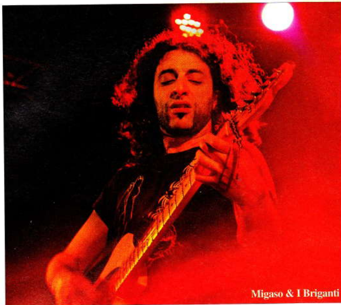
Migaso & I Briganti