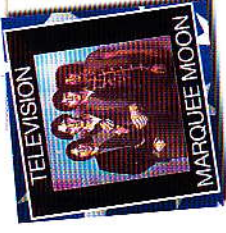
TELEVISION Marquee Moon. EMI

Television et son leader à l'âme sombre, Tom Verlaine, font monter le punk du garage au salon. Chez eux, les guitares sont réfléchies, les paroles complexes et torturées à souhait. Ce «Marquee Moon», c'est aussi la preuve que le Velvet Underground a directement inspiré toute une frange new-yorkaise punk, qui privilégie, à la haine frontale, un certain dandyisme teinté d'arrogance. Franz Ferdinand leur doit beaucoup.