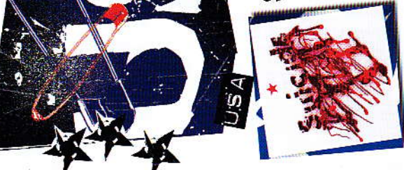
SUICIDE Suicide. EMI

Les New-Yorkais Alan Vega et Martin Rev n'ont pas choisi ce nom gratuitement. Dans leurs têtes, une seule couleur : le noir. Cette dépression va tout de même leur permettre d'enregistrer l'un des plus grands disques de punk, sans la moindre guitare et batterie !