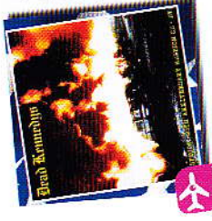
DEAD KENNEDYS Fresh Fruit For Rottin' Vegetables. Frac Import