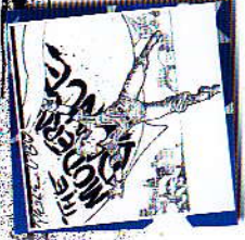
PERE UBU The Modern Dance. Frac Import