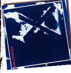
X Los Angeles. Frac Import

Côte ouest, le punk avait aussi des choses à dire. Cet album de X, de