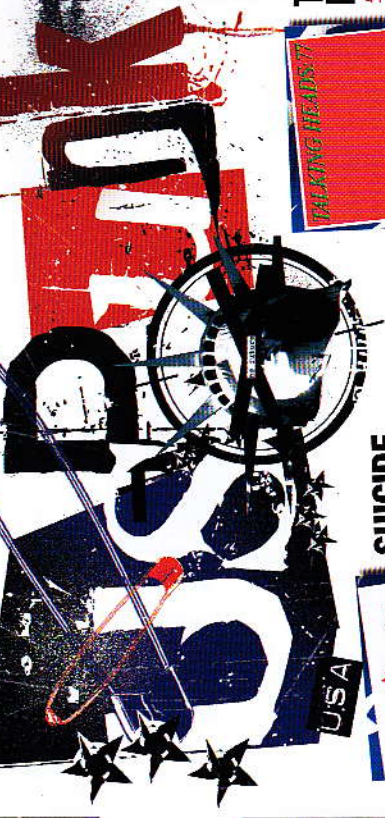
TALKING HEADS Talking Heads : 77. Warner

David Byrne et ses Talking Heads appartiennent à la famille des punks new-yorkais dotés d'un cerveau bien rempli et fréquentant autant les clubs que les salons branchés. Ici, pas de rage sonique, pas de saturation intempestive ni de vocaux vomis. Les Talking Heads, comme Television, prennent le temps d'installer leurs ambiances malignes et contournent les codes d'une scène déjà sclérosée. Le titre «Psycho Killer» reste un must !