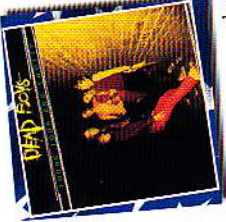
DEAD BOYS Young Loud and Snotty. Warner

Les Dead Boys quittent rapidement Cleveland pour New York. Là, Stiv Bators, à la voix et Cheetah Chrome, à la guitare, balancent en 1977, ce formidable «Young Loud and Snotty», littéralement «jeune, Bruyant et Arrogant», ce qui colle parfaitement à leur musique abrasive et à leur attitude de branleurs doués. En intro d'album, le groupe lance un appel à la jeunesse en hurlant «Je n'ai besoin de personne, ni de papa et maman, ni de la race humaine !». Tout un programme.